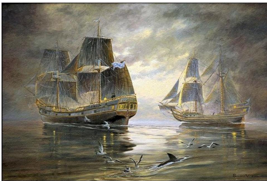
Корабли Витуса Беринга. Художник В. Ширяев

Шпаро, Д. Прекрасные лица бесстрашных людей / Д. Шпаро // Техника-молодежи. – 2001. – № 9. – С. 34–39. О второй Камчатской экспедиции (1733 – 1741 гг.)