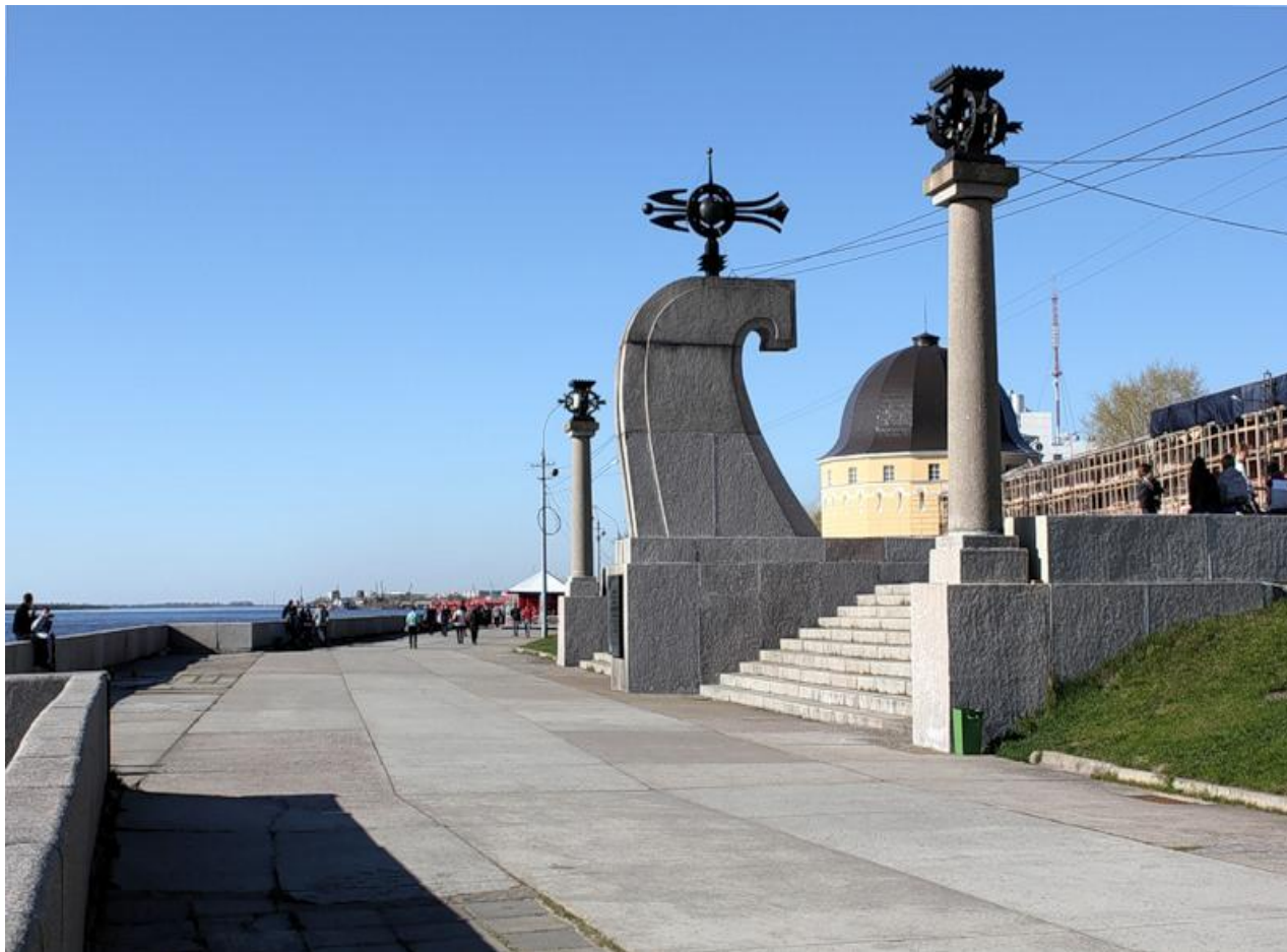
Набережная Северной Двины, напротив Гостиных дворов.

Здесь в 1584 году началось строительство Архангельска. Почетный знак «400 лет основания Архангельска» сооружен по решению Архангельского горисполкома в 1984 году в ознаменование юбилея города. Расположен на набережной Северной Двины, в ее исторической части – на мысе Пур-Наволок, где был заложен город.