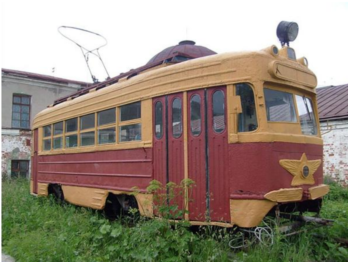
Памятник архангельскому трамваю установлен у Гостиных дворов, модель КТМ1–8 1957 года выпуска.

Архангельский трамвай — закрытая трамвайная система, существовавшая в городе Архангельске с 1916 по 2004 год. Долгое время она являлась самой северной трамвайной системой в мире.