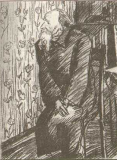
• Б.В. ШЕРГИН. 1970-е гг. Рис. В. Дувидова. Хотьково

презентации книг В. Матонина, М. Попова, А. Роскова.