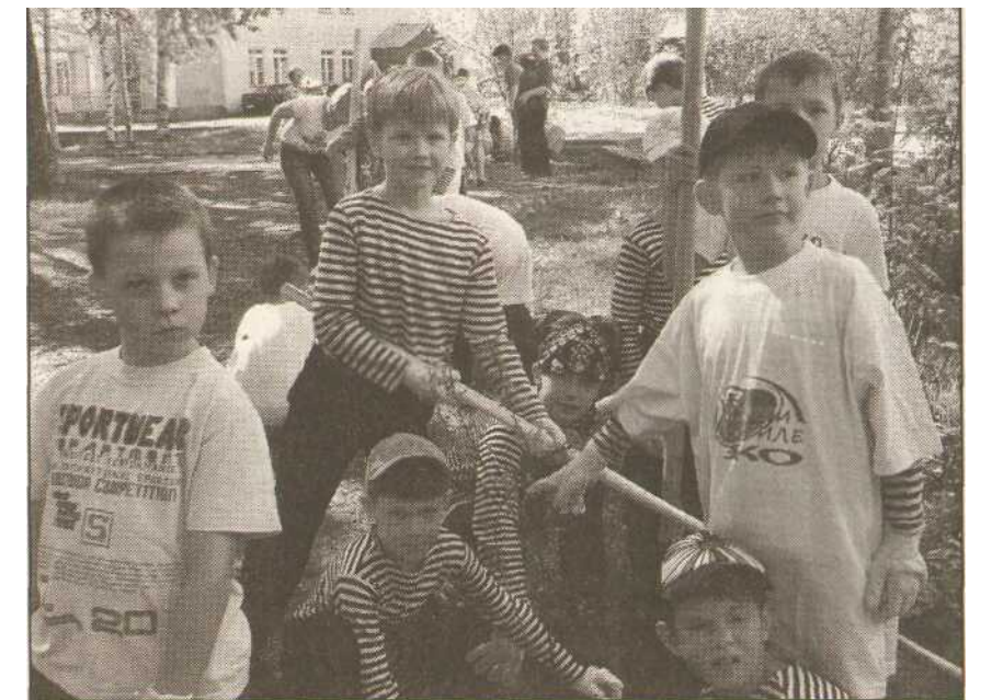
*Акция «РОЗОВЫЙ куст». Соломбальские школьники высаживают кусты шиповника около библиотеки

Расчётный счет: № 40703810204010100374 в Архангельском ОСБ 863 БИК 041117601 к/сч 30100181010000000060 «На памятник Борису Шергину».