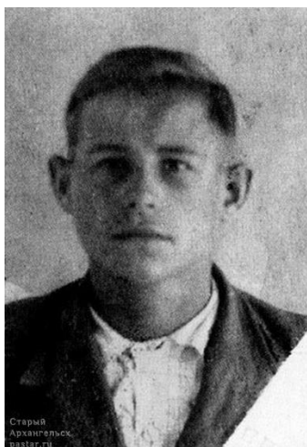
Фото Николая Рубцова из медицинской карточки. Материалы из музея Архангельского тралового флота

И все же в холодные ночи Печальней видений других Глаза ее, близкие очень, И море, отнявшее их.